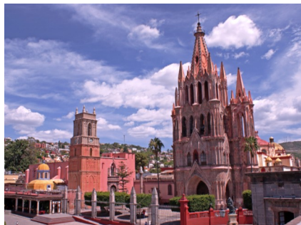
San Miguel de Allende, Guanajuato

Hoteles en la Ruta son 4* o similares y serán confirmados de acuerdo a disponibilidad