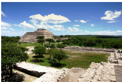
Zona Arqueológica la Cañada, Guanajuato