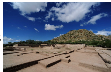
Zona Arqueológica el Cópore, Guanajuato