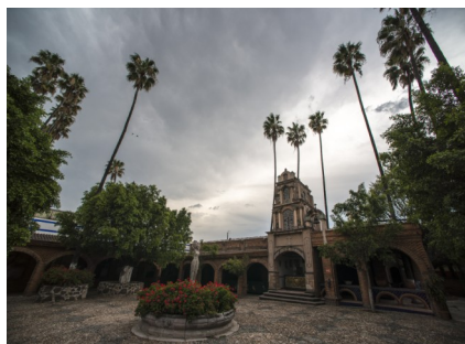
Hacienda Corralejo, Guanajuato